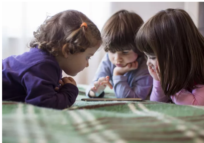
Robô entrega livro infantil digital pelo WhatsApp

07 Abr 2020 - 19h26 | Atualizado em 07 Abr 2020 - 19h26